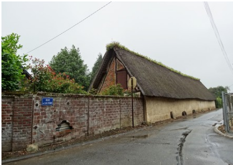
Une maison aux abords