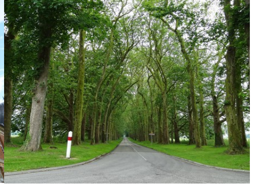
La perspective vers le Sud

Pour la zone en rose foncé dans le périmètre de 500m