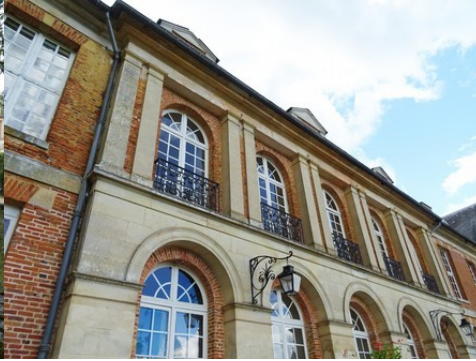
L'avant-corps en pierre (détail)