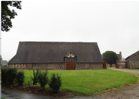
Des exemples d'architecture rurale