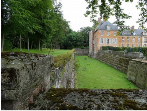
Les fossés (côté ouest)