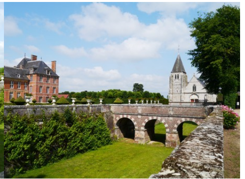
La vue vers l'église et le château