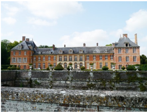
Le château vu du Sud