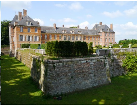
La château vu du Sud-Ouest