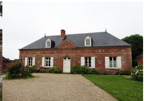
L'école du village